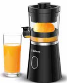
Imágenes de carácter ilustrativo