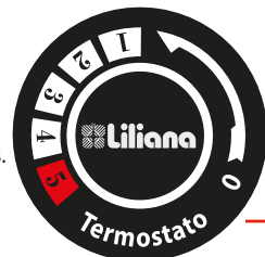
TABLA APROXIMADA DE EQUIVALENCIAS DE TEMPERATURA

5 Temperatura reservada para cocinar bifés y asar carnes. En esta temperatura deberá verificarse la posible proyección de calor hacia la mesada donde deberá proveerse la correspondiente aislación térmica.