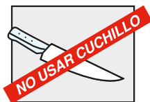
Imagen solo de carácter ilustrativo

La superficie de cocción está recubierta con cobre, por lo que deben extremarse los cuidados sobre la misma para no dañar o rayar. NO CORTAR alimentos sobre esta superficie.